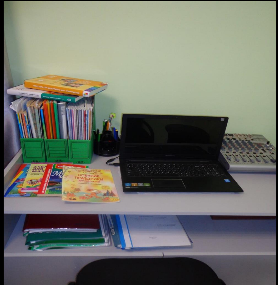
1.7. Рабочий сектор (ИКТ для педагога)