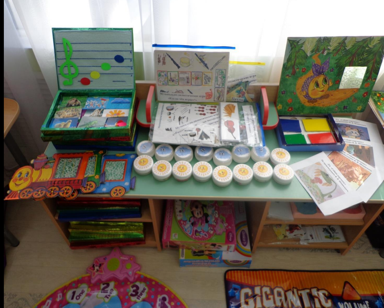
Музыкально – дидактические игры, музыкальные коврики, игровой макет